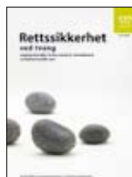
Rettsikkerhet med fryg IS-1467